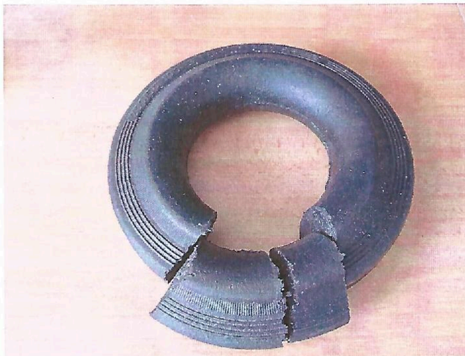
Obr. č. 1 – Vzorek č. 412105540/01 - Pryžová obruč PV / PX 200