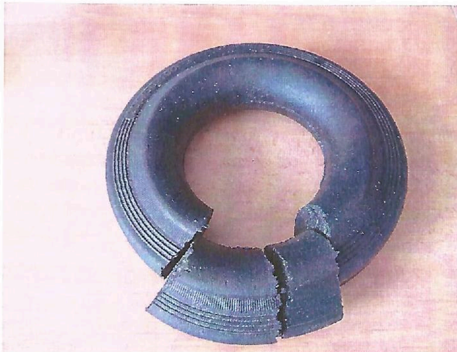
Fig. 1 – Sample No.412105540/01 - Rubber hoop PV / PX 200